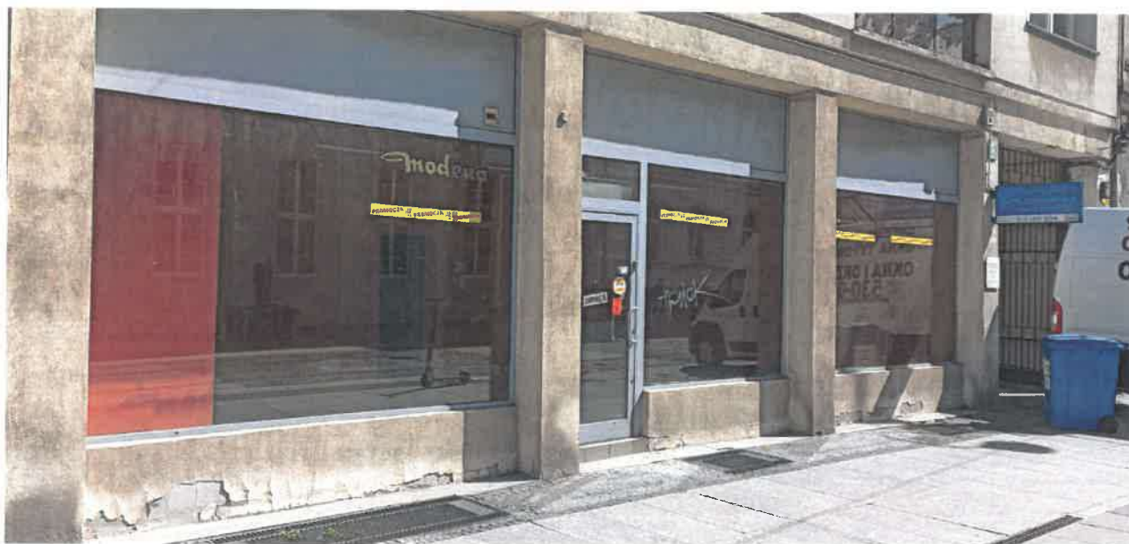
Ul. 3-go Maja 31